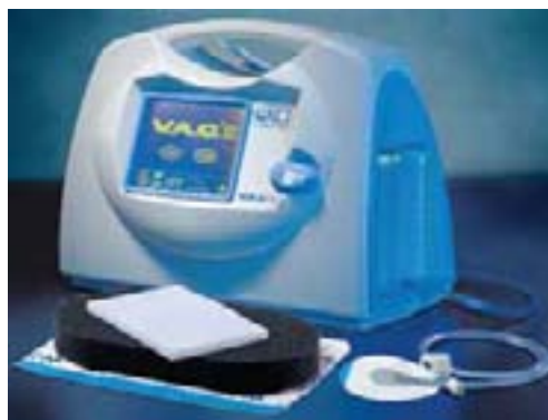
Equipo portátil de terapia V.A.C.

Nos place informarles que esta nueva terapia ya está disponible para los socios del Plan de Bienestar.